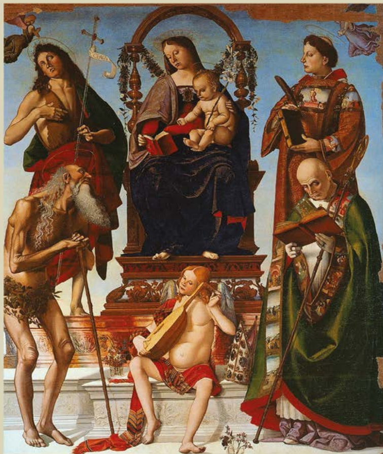
Perugia - Museo del Capitolo della Cattedrale di San Lorenzo - Pala di Sant'Onofrio (1484)