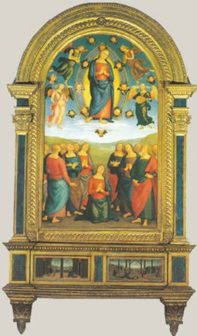
Corciano - Chiesa di Santa Maria Assunta Vergine Assunta in Cielo (1505)