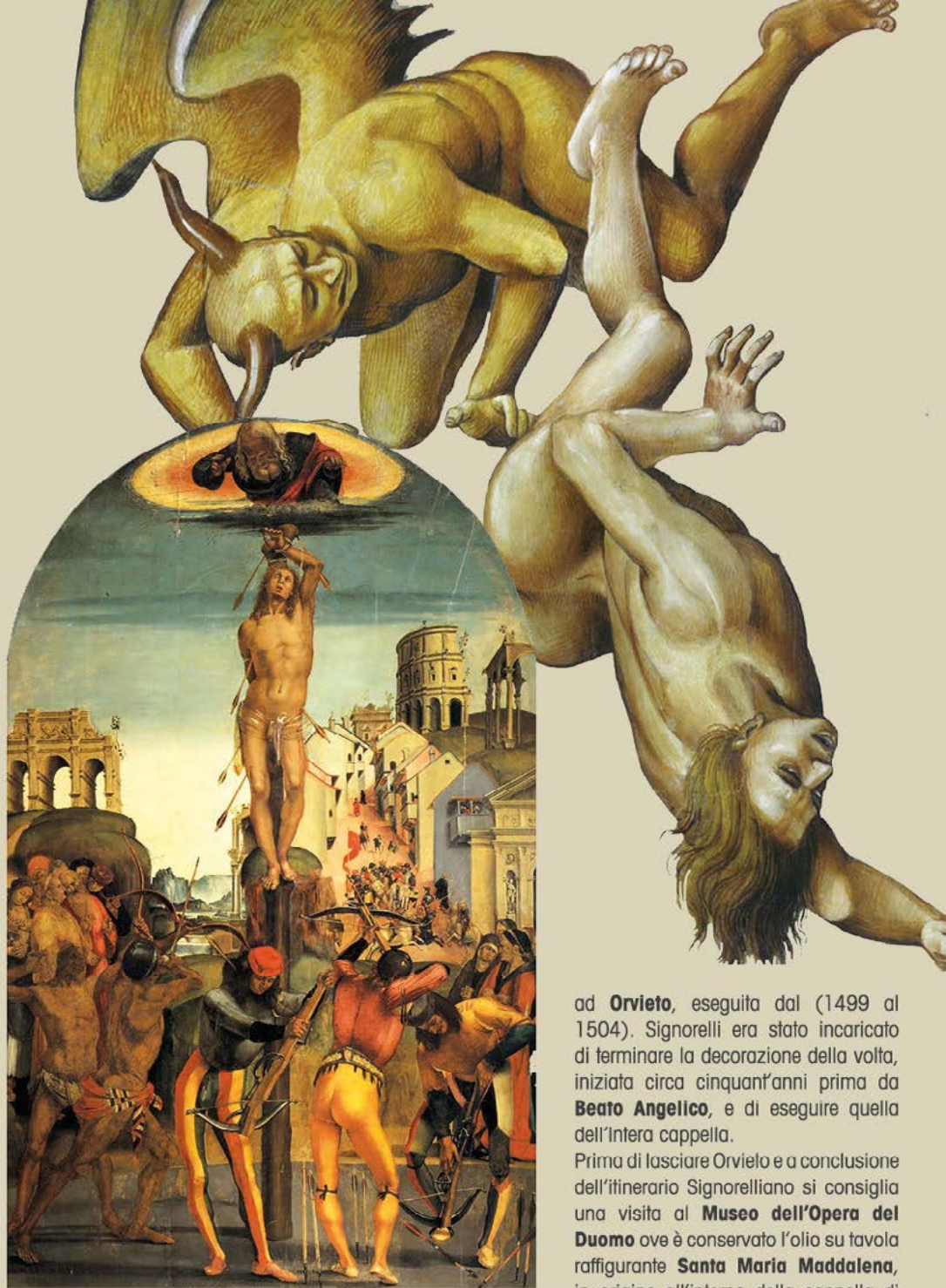
Città di Castello - Pinacoteca Martirio di San Sebastiano (1498)

ad Orvieto , eseguita dal (1499 al 1504). Signorelli era stato incaricato di terminare la decorazione della volta, iniziata circa cinquant'anni prima da Beato Angelico , e di eseguire quella dell'intera cappella.