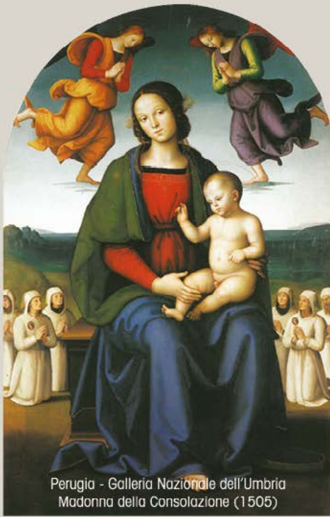
Perugia - Galleria Nazionale dell'Umbria Madonna della Consolazione (1505)

Da Città della Pieve si procede per Panicale , piccolo borgo medievale, nella Chiesa di San Sebastiano è custodito l'affresco dedicato al Martirio del Santo (1505), raggiungiamo poi Fontignano , dove nella Chiesa dell'Annunziata si trova il suo ultimo lavoro la Madonna in trono col Bambino , nella stessa chiesa è ospitata la sua tomba, proseguiamo per Corciano ; nella Chiesa di Santa Maria Assunta è custodita una pala d'altare raffigurante la Vergine Assunta in cielo . A Perugia , nella Galleria Nazionale dell'Umbria sono esposte varie opere tra cui l' Adorazione dei Magi , il gonfalone con la Pietà e la Madonna della Consolazione . Nel Collegio del Cambio il Divin Pittore affrescò la Sala delle Udienze dove è presente il suo autoritratto. Nella Cappella di San Severo è possibile ammirare l'affresco Trinità e Santi , iniziato da Raffaello.